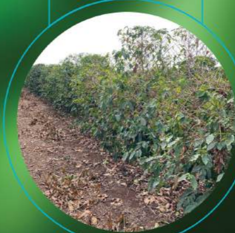
Três Corações - MG