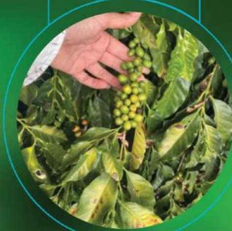
Presidente Olegário - MG