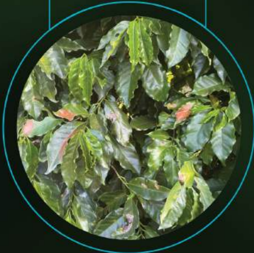
Presidente Olegário - MG