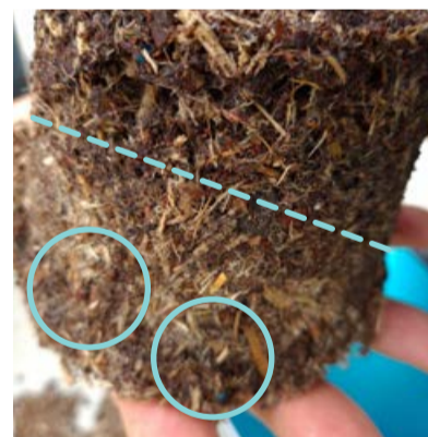
Viditelná suchá místa a vznikající suché zóny v bezrašelinovém substrátu